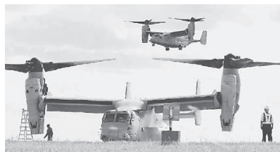
奄美空港に着陸したオスプレイ=2日

員長はオスプレイ墜落について「開発段階から事故を繰り返し、構造的な欠陥機と言われてきた。そういうオスプレイの配備を容認し、さらに自衛隊への導入を推進してきた自公政権の責任はきわめて大きい」と指摘しました。