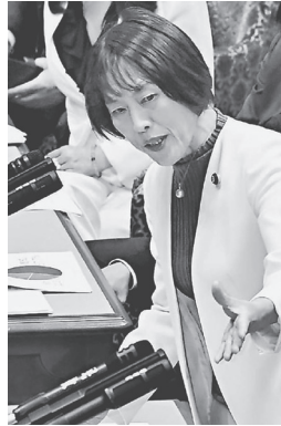
質問する田村智子副委員長=11月28日、参院予算委