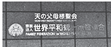
統一協会本部=東京都渋谷

「朝日」6、7日付によれば、盛山氏は選挙公示2日前に統一協会の関連団体の会合に出席し、推薦確認書に署名。選挙期間中は関連団体の会員10～20人が同氏事務所で連日、有権者に