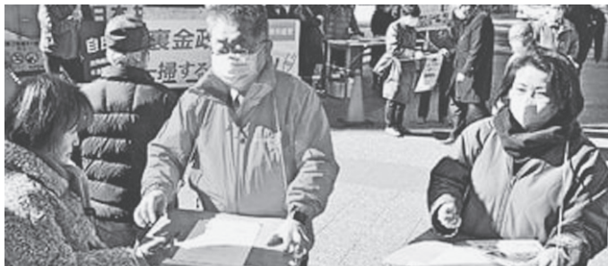
署名を訴える小池書記局長 (左から3人目)ら3日、 東京・池袋西口