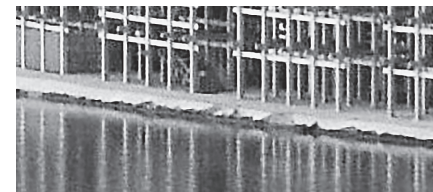
浸食されているリングの護岸

日本国際博覧会協会は11日までに、大阪・関西万博の大屋根「リング」の水面護岸計1.1kmのうち600mで浸食被害が確認されたと明らかにしました(写真)。協会関係者からは「ここまで崩れるとは想定していなかった」との声も出ています。